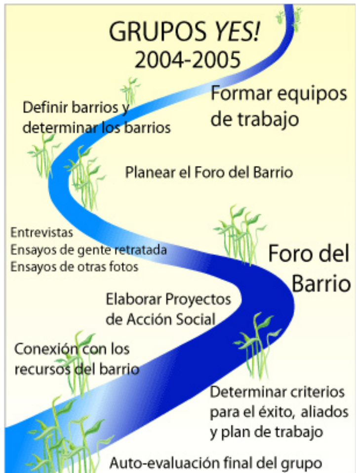
Itinerario del viaje por el río YES!

Los grupos usarán en su momento la información de la entrevista y las fotografías que tomen para crear una exposición que resalte los puntos fuertes del barrio. Invitarán a la gente entrevistada y a otros estudiantes, adultos y familiares a un evento llamado Foro del Barrio.