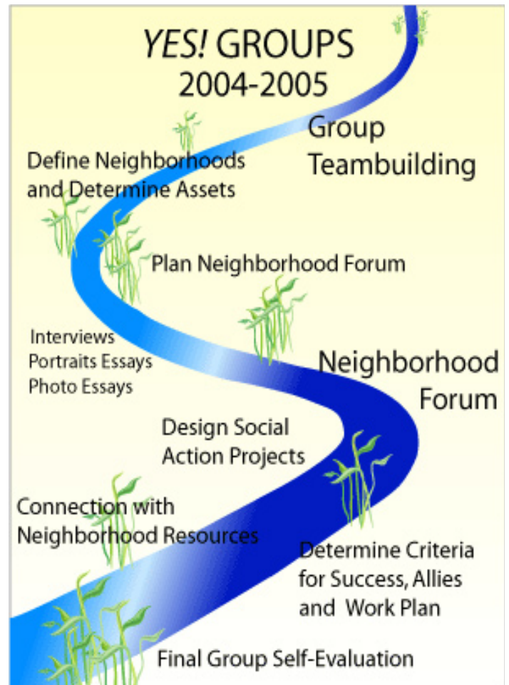
Itinerary of the journey in the YES! river.

The groups will use the interview information and the photographs they take to create a display to honor the neighborhood assets. They will invite the people they interviewed and other students, adults and family to an event called a Neighborhood Forum.